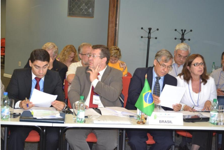
Representantes de las Instituciones brasileñas participantes en el Programa

El envejecimiento de la población representa el mayor logro de humanidad y se cree que en un futuro próximo todos los países experimentarán este fenómeno, aunque en diferentes niveles de intensidad y de estructura temporal. Si en un principio era más notable entre los países desarrollados, recientemente ha surgido como un gran desafío para los países en desarrollo: el 80% de los adultos mayores en el mundo viven en estos países.