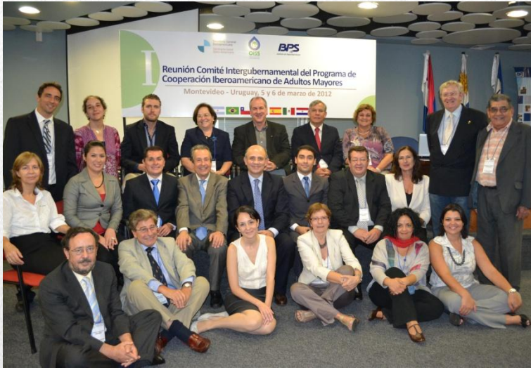
Miembros del Comité Intergubernamental durante la primera reunión, Montevideo, Uruguay, 5-6 de marzo de 2012

Formado por los representantes de los ocho gobiernos participantes en el Programa – Argentina, Brasil, Chile, Ecuador, España, México, Paraguay, y Uruguay-, junto a las entidades promotoras del Programa, la Secretaría General Iberoamericana (SEGIB) y la Organización Iberoamericana de Seguridad Social (OISS), el Comité Intergubernamental del Programa sobre Adultos Mayores tuvo su primera reunión en la ciudad de Montevideo los días 5 y 6 de marzo de 2012.