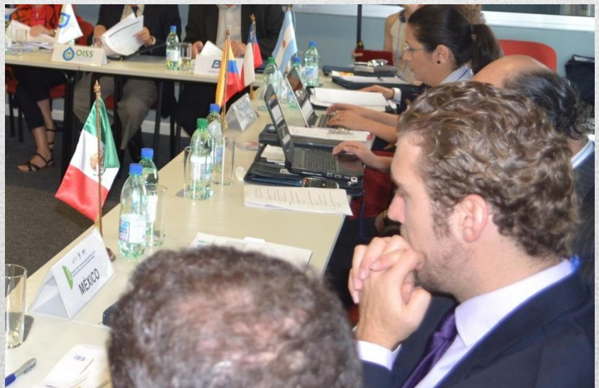
Representantes de las instituciones mexicanas participantes en el Programa